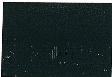
【The night view from our facility】