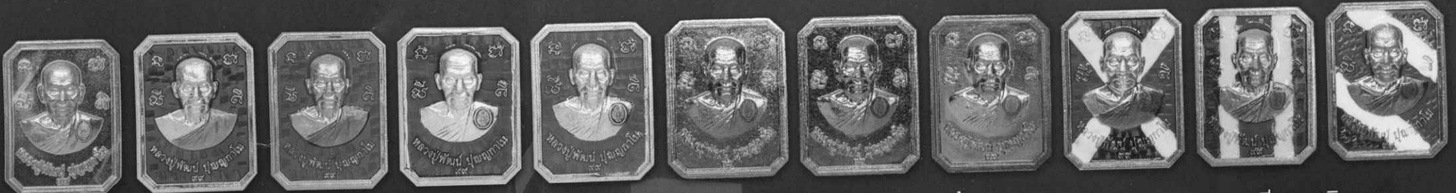
เนื้อทองคำ

เนื่องในโอกาสครบรอบ ๙๙ ปี มหาวิทยาลัยราชภัฏนครสวรรค์ เพื่อช่วยเหลือสนับสนุนทุนการศึกษาให้กับนักศึกษาที่ขาดแคลนทุนทรัพย์